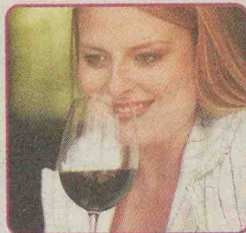
deur Annareth Bolton van Stellenbosch Wynroetes